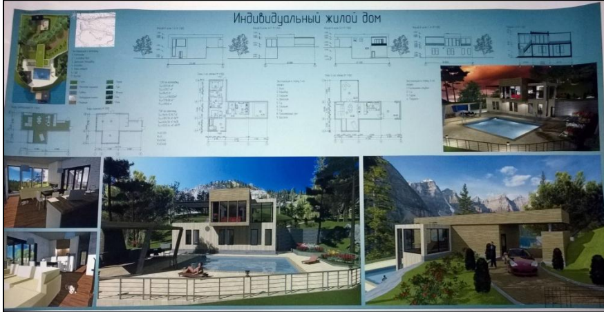
Роботи студентів з архітектурного проектування та рисунку на 2-му курсі

Також кафедра Основ архітектурного проектування і рисунку проводить такі базові практики: